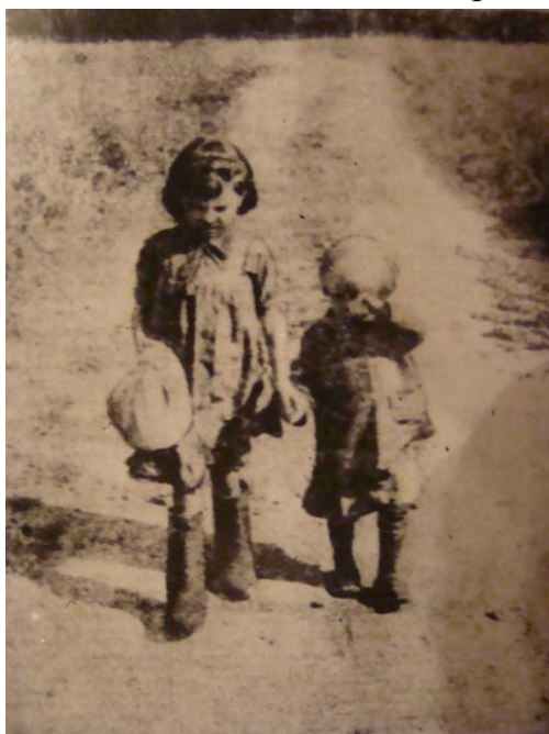
Фото в газете «За честь Родины»

Когда в марте 1943 года одна из частей Советской Армии освободила