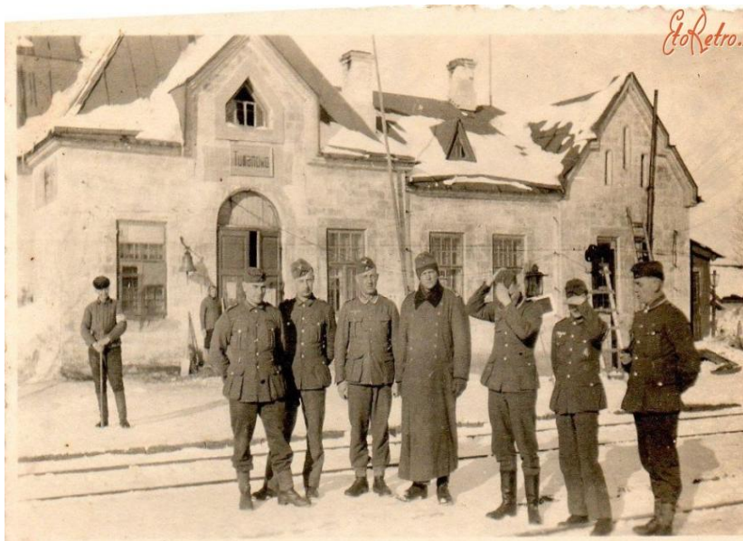
Немецкие захватчики на станции Туманово

Перед отступлением немцы вывезли военнопленных в неизвестном направлении, а в деревне оставили шесть палачей для того, чтобы согнать всех жителей в сарай и сжечь. Но злые замыслы фашистов сорвались. Советская Армия 8 марта 1943 года освободила деревню Комарово».