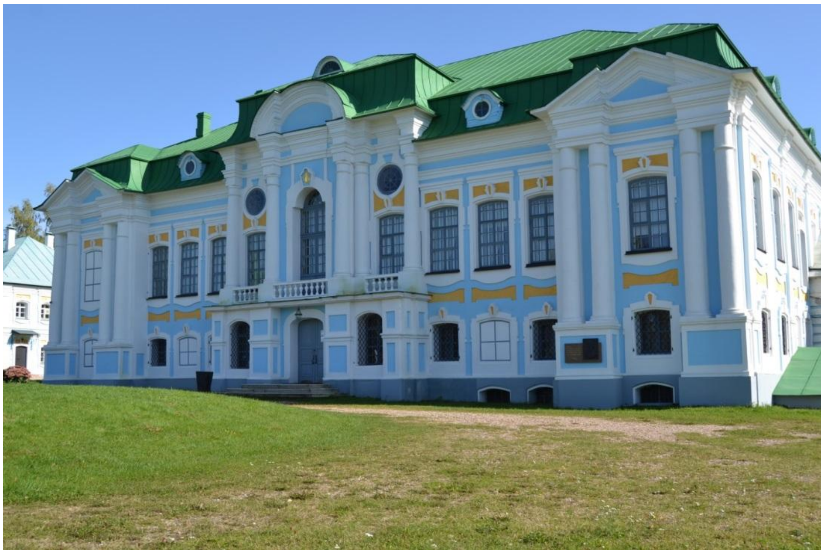
Хмелита. Главный дом после реставрационных работ Фотография конца 1990-х гг.