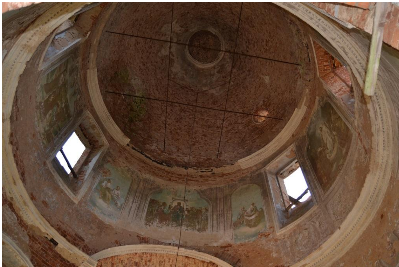
Сохранившиеся фрески в церкви Спаса Преображения

В настоящее время в усадьбе ведутся проектные и реставрационные работы, рассматриваются возможности создания будущих экспозиций, связанных с историей усадьбы и ее владельцами, воссоздания бывшей сыроварни, здание которой сохранилось, обсуждается концепция экологической тропы по маршруту «Хмелита-Григорьевское»