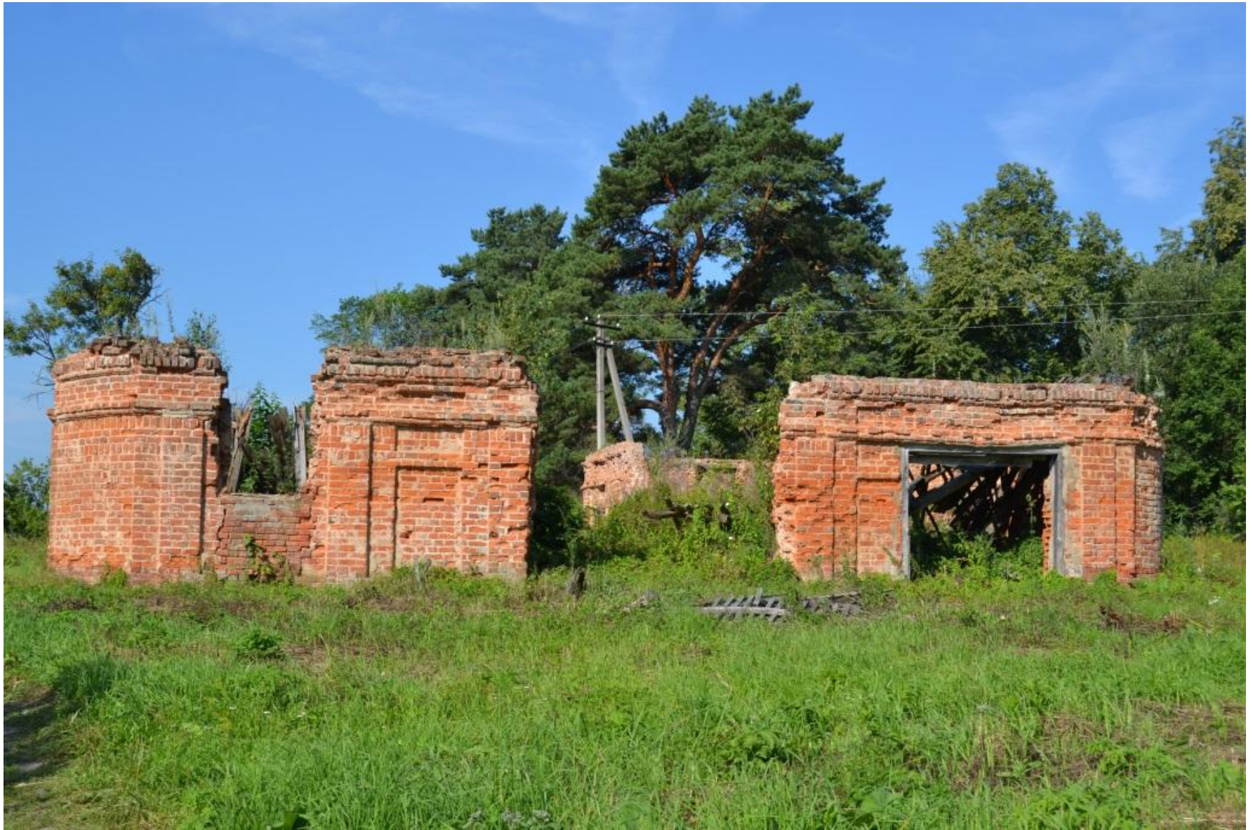
Современное состояние здания кордегардии в Григорьевском