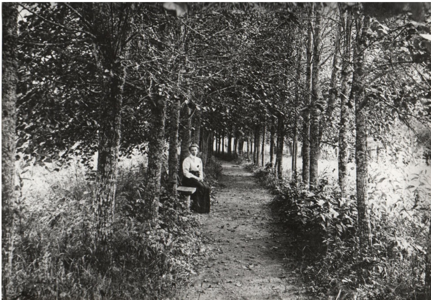
Аллея в парке. Фото нач. XX в.