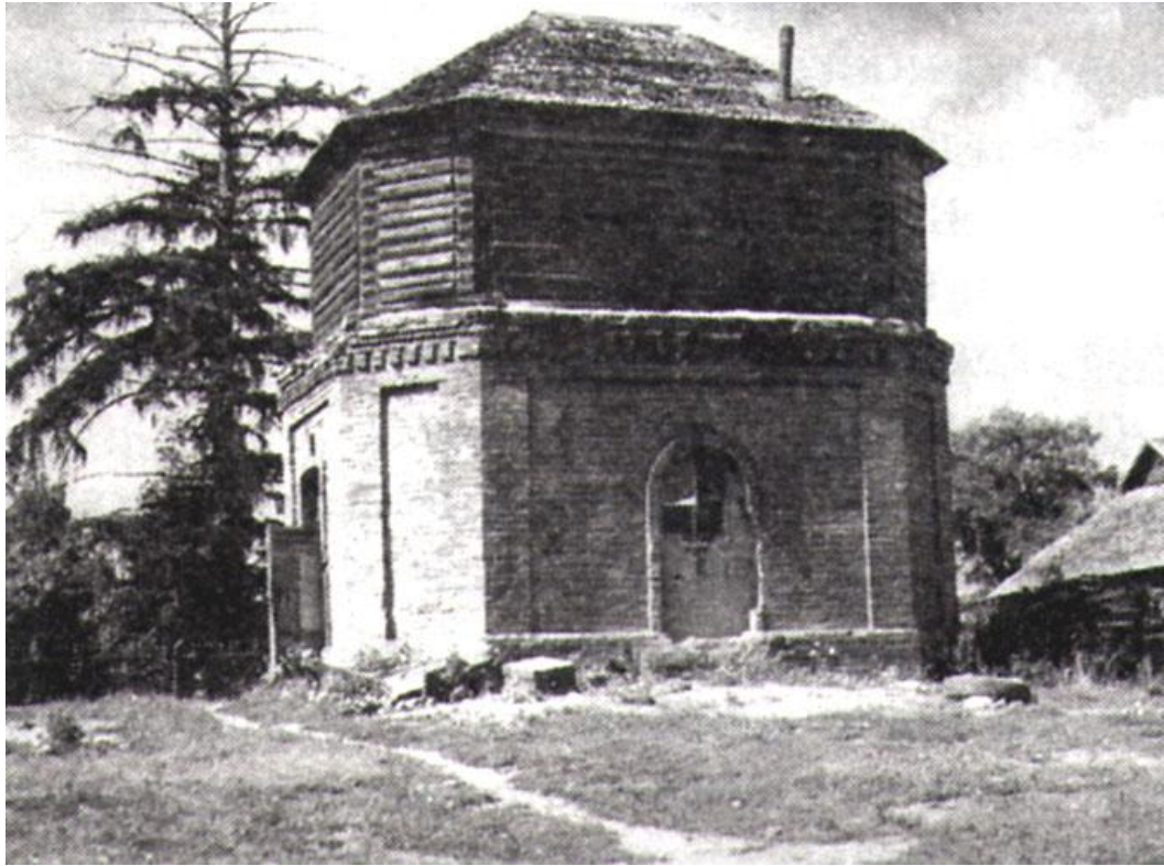
Артезианский колодец Фото кон. XX в.