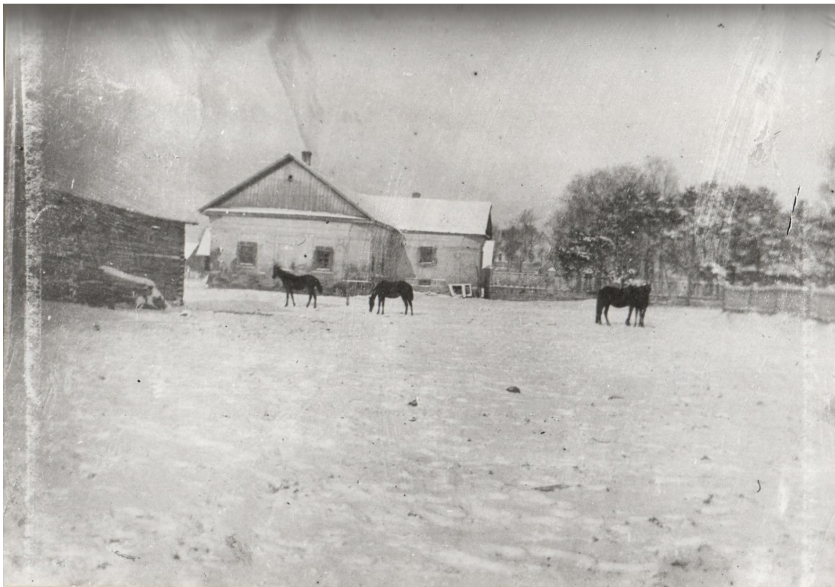
Вид западной кордегардии и каретного сарая