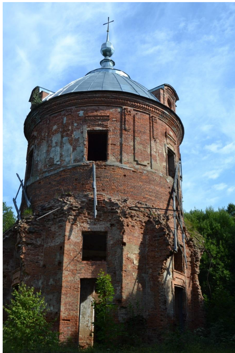
Церковь Спаса Преображения Фото 2018 г.