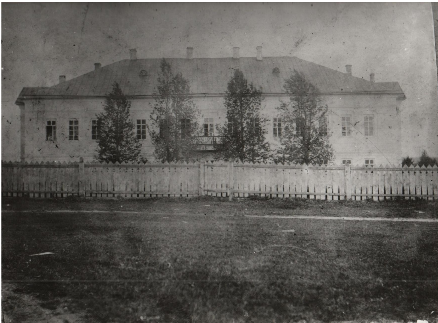
Общий вид дома с севера Фото нач. XX в.