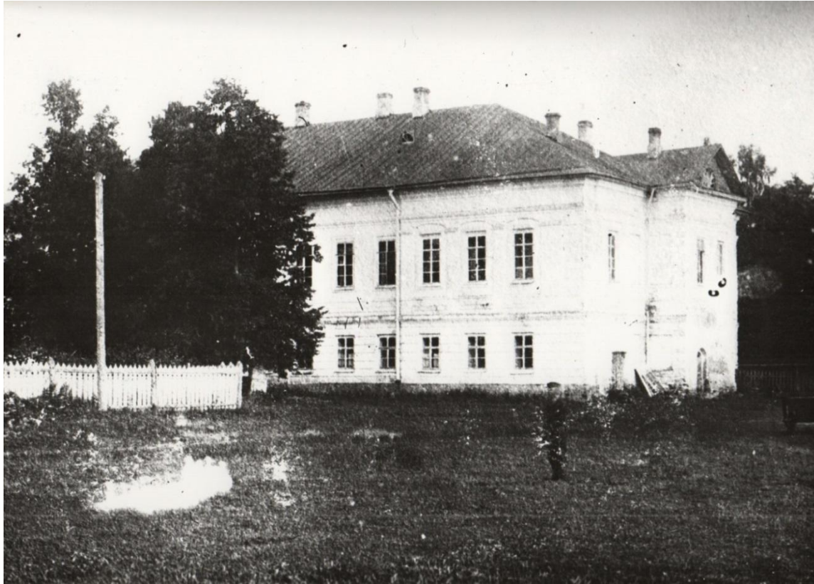
Фрагмент усадебного дома с северо-запада. Фото нач. XX в.

В XVII в. принадлежала Григорию Грибоедову , позже перешла к родственникам Грибоедовых дворянам Лыкошиным , которые бережно сохраняли предания о посещении юным Александром Грибоедовым этого имения.