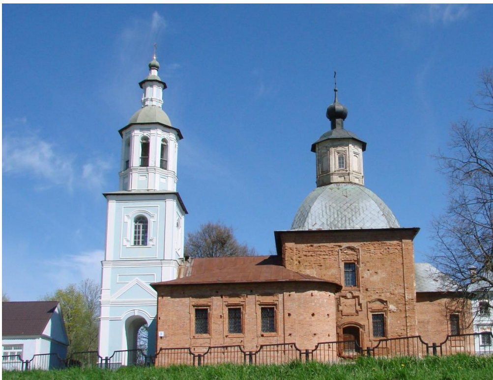
Церковь иконы Казанской Божией Матери Фото 2011 г.

В 1982-1992 гг. была проведена масштабная реставрация церкви, и в 1992 г. в ней начались богослужения