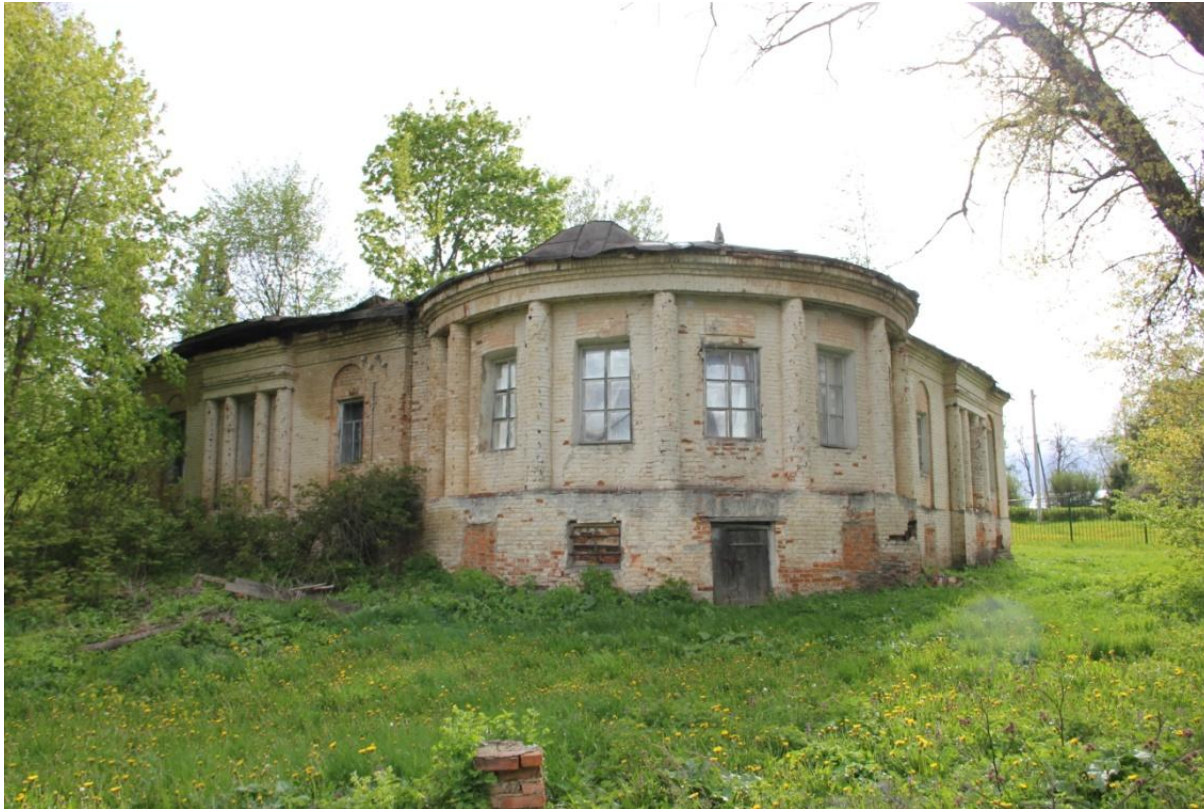
Флигель усадьбы. Современный вид