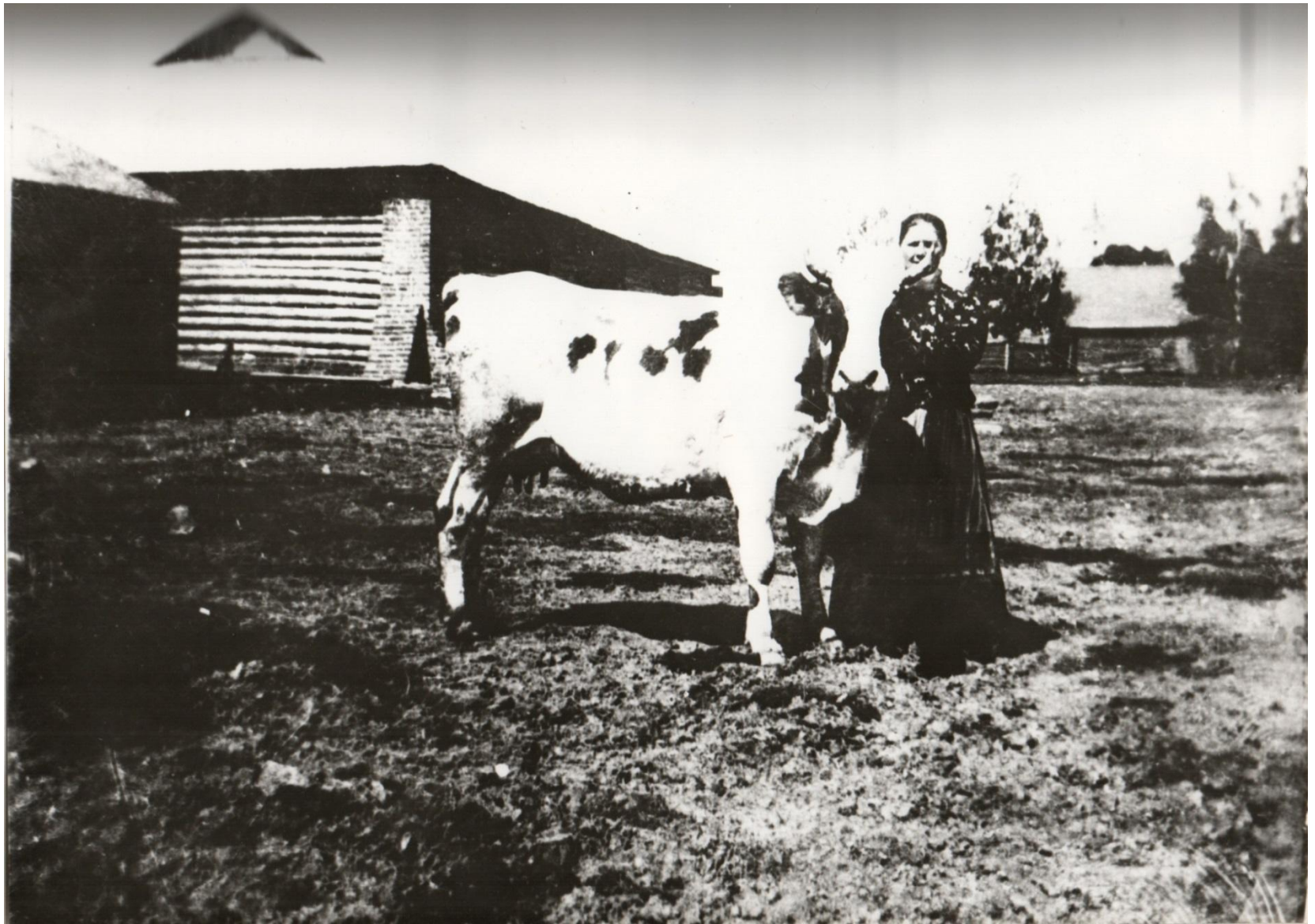
Скотный двор. Вид с юга Фото нач. XX в.