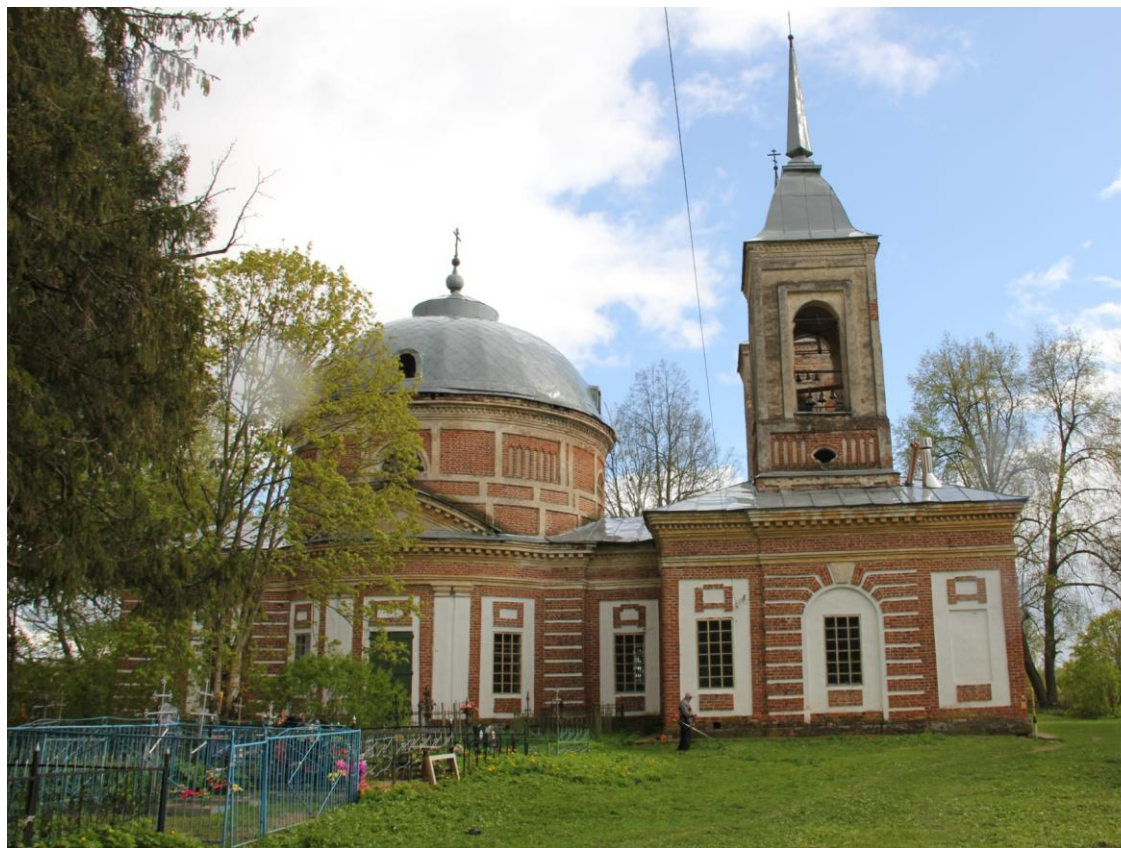
Действующая церковь Преображения Господня в Липицах. Фото 2020 г.

В Липицах сохранилась Церковь Преображения Господня с приделами во имя Св. Николая и Св. архиепископа Стефана, которая была достроена по наброскам А.С. Хомякова в 1830-х гг. В ней находятся иконы, некоторые из которых написаны по рисункам и эскизам А.С. Хомякова, который учился живописи в Париже