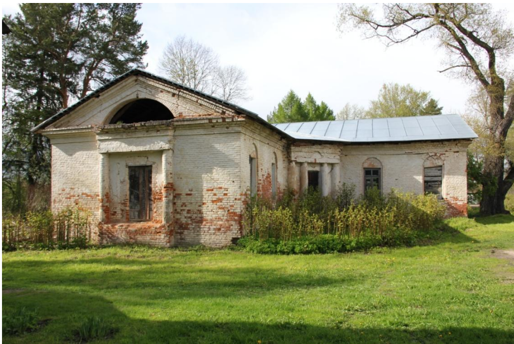
Флигель усадьбы. Современный вид Фото 2020 г.

В Липицах в течение многих лет проводит мероприятия, связанные с сохранением и популяризацией усадьбы, Музей-заповедник «Хмелита»: здесь проходят конференции, посвященные А.С. Хомякову , установлена мемориальная доска на сохранившемся усадебном флигеле, возведена новая крыша на этом здании, предохраняющая его от дальнейшего разрушения, организуются экскурсии