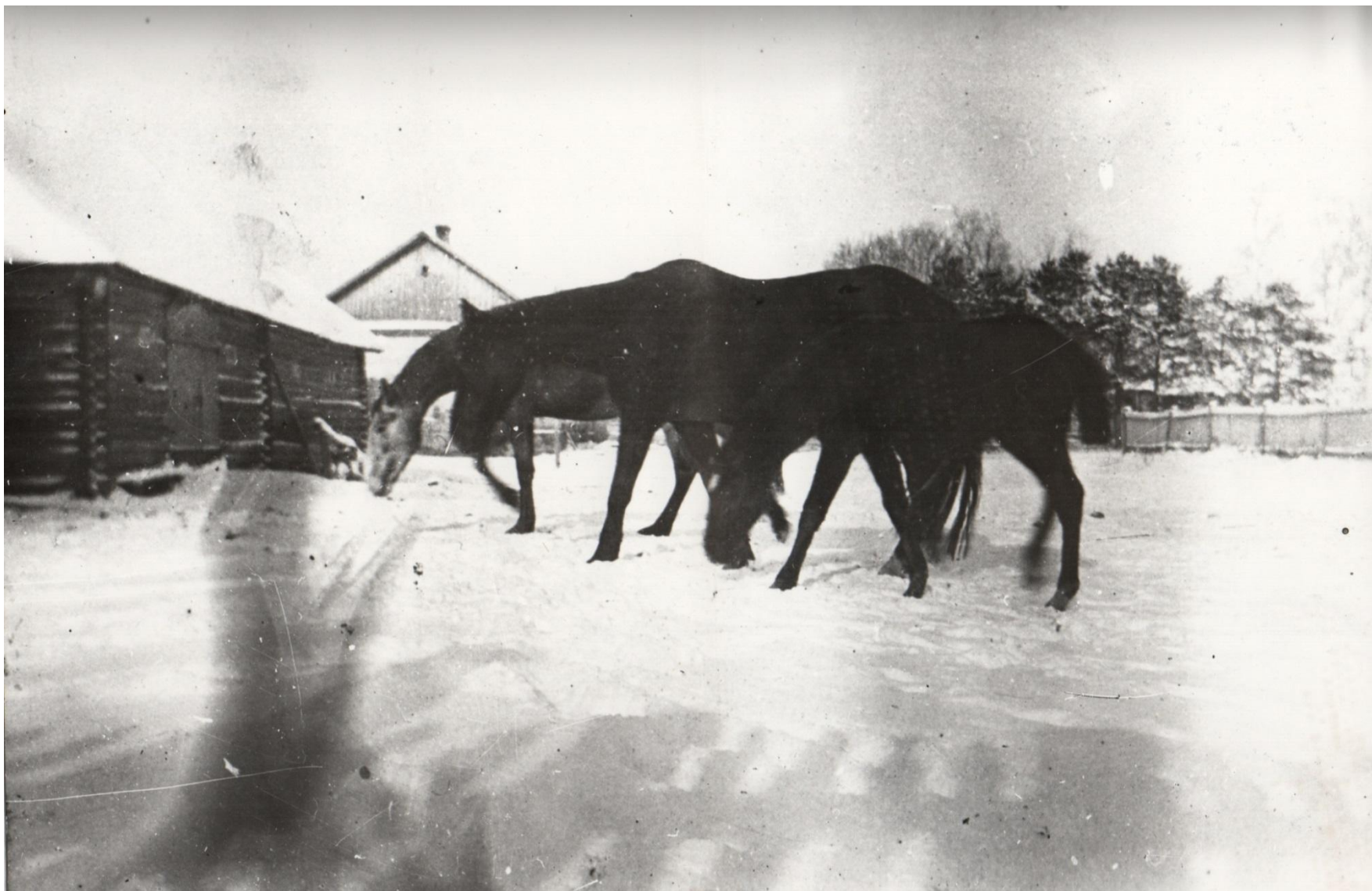
Кони на парадном дворе усадьбы