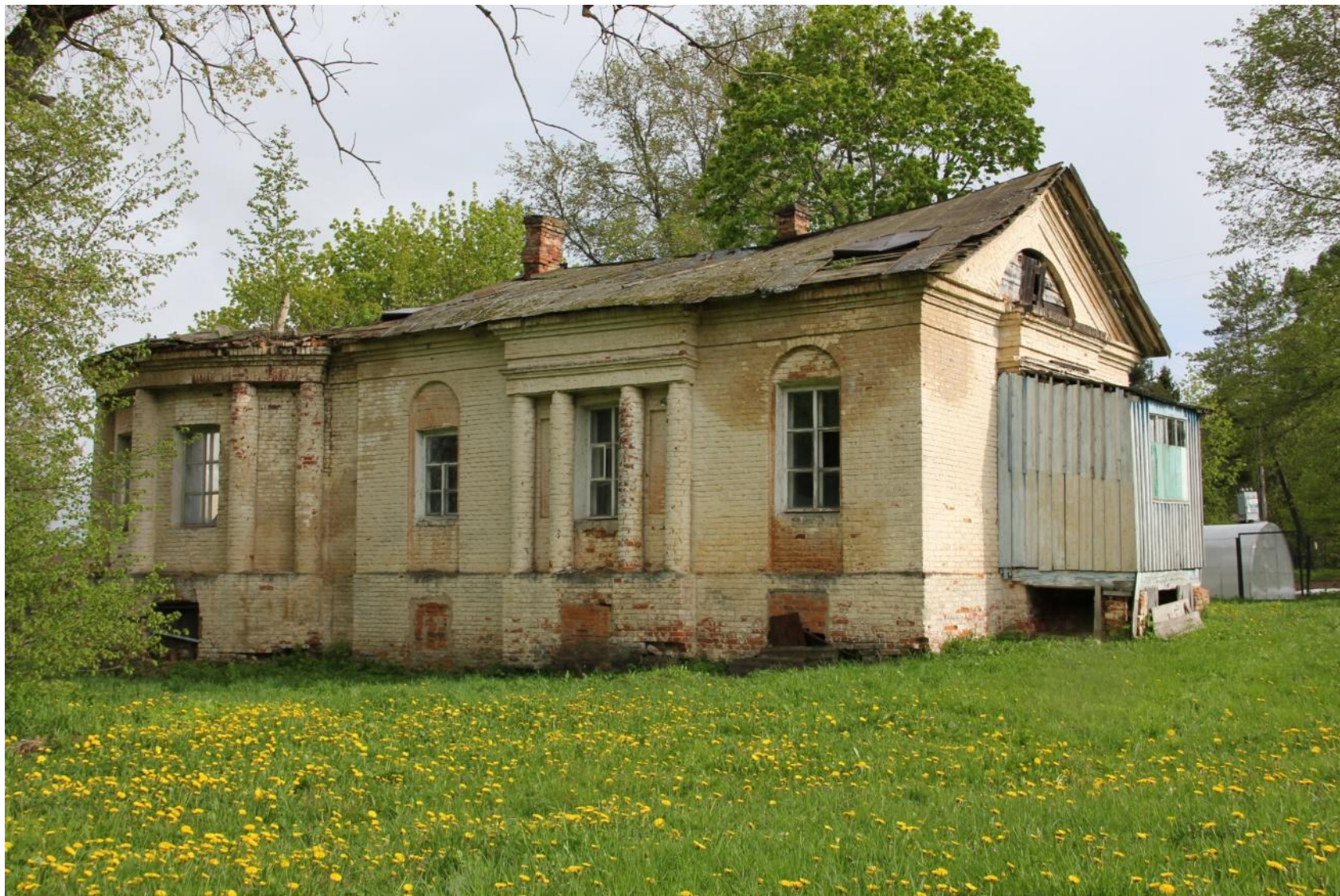
Флигель усадьбы Липицы. Современный вид Фото 2020 г.