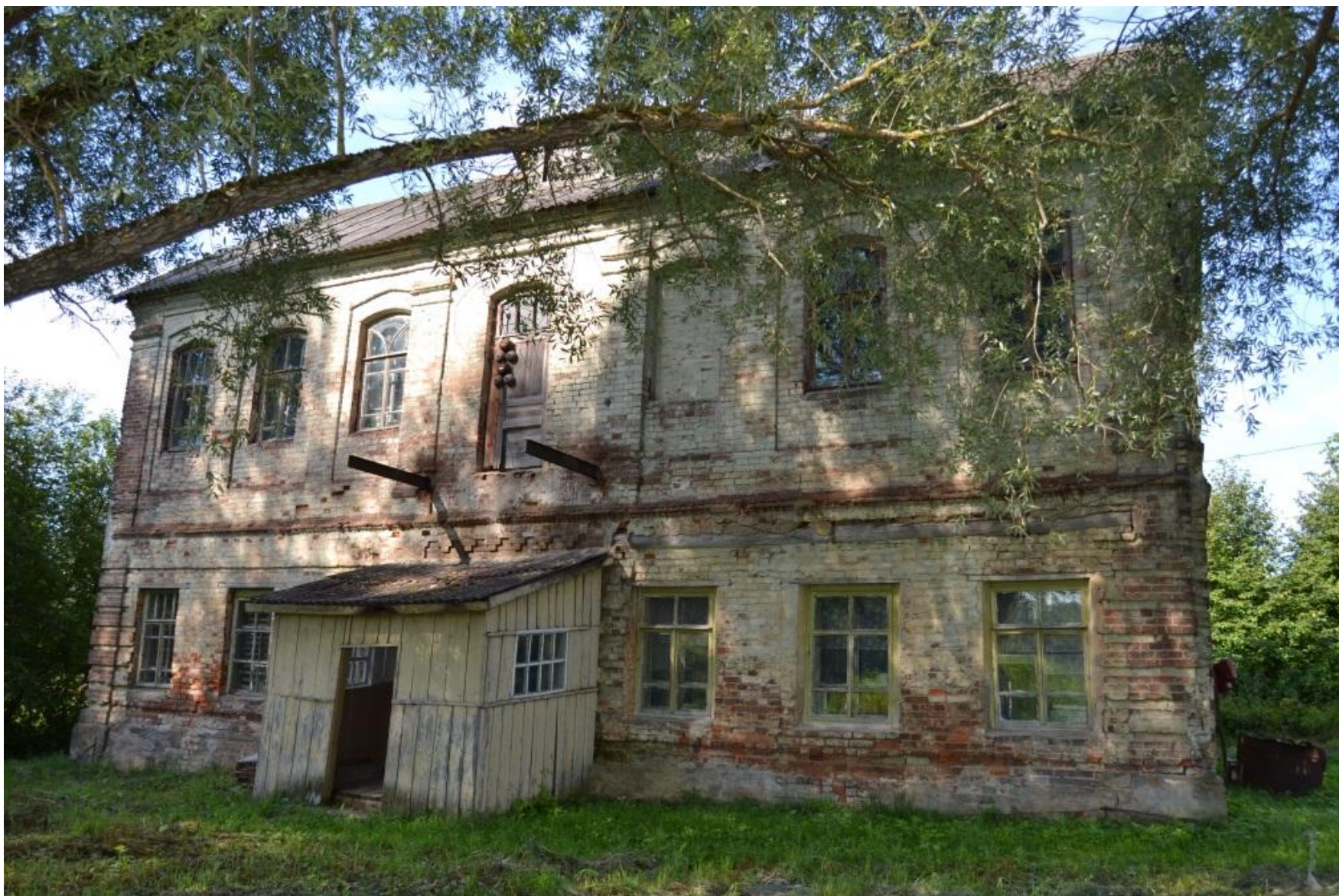
Современное состояние здания винокуренного завода