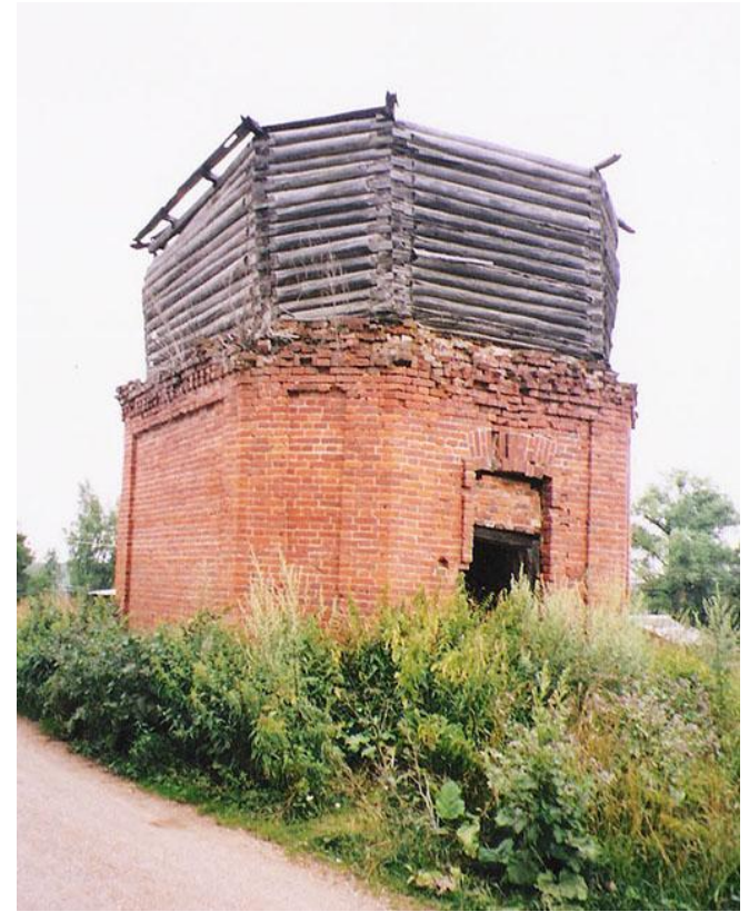
Артезианский колодец Фото 2011 г.

От конца XIX в. сохранилась хозяйственная постройка – артезианский колодец – уникальный образец бытовой усадебной архитектуры