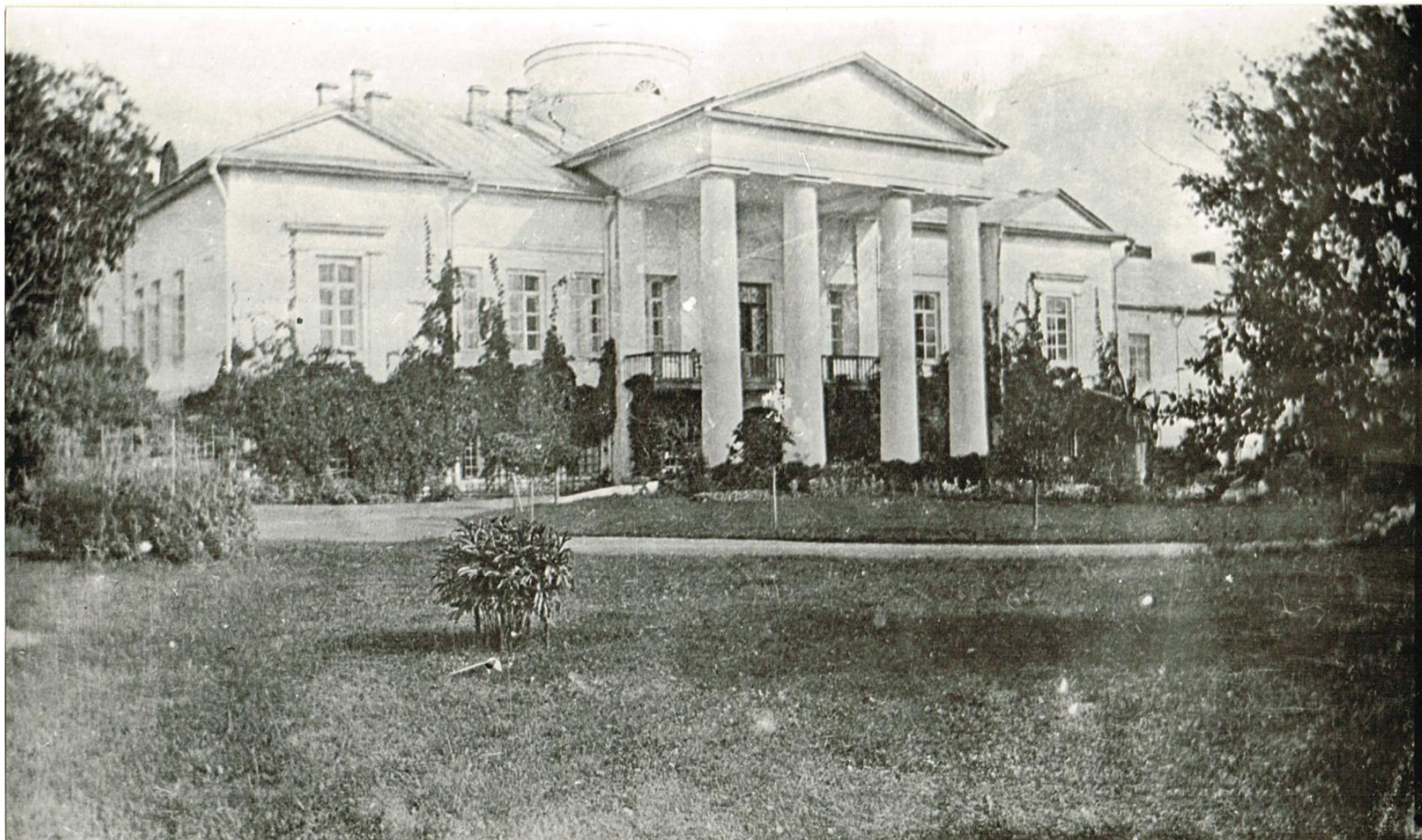
Хмелита. Западный фасад главного дома Фото кон. XIX – нач. XX вв.