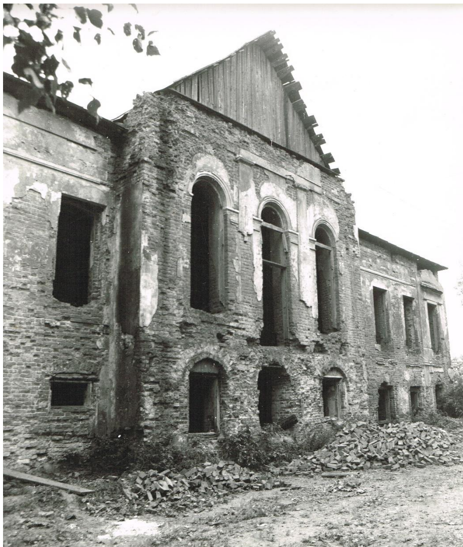
Хмелита. Фасад главного дома Фото Виталия Рудченко, 9 сентября 1979 г.

Хмелита, переживя тяжелые годы революции, Великой Отечественной войны и оккупации, погибла в пожаре в 1954 г.