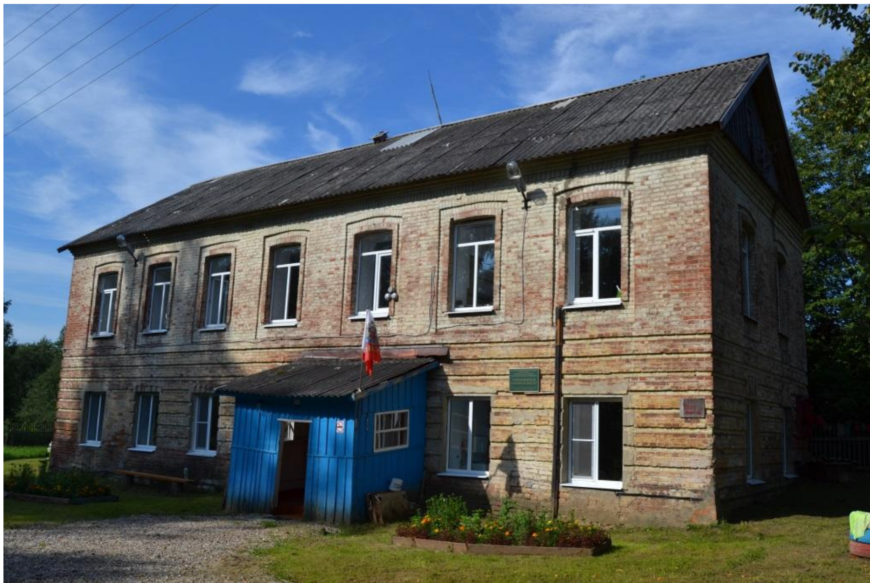
Современное состояние бывшего здания винокуренного завода в Григорьевском. Фото 2018 г.