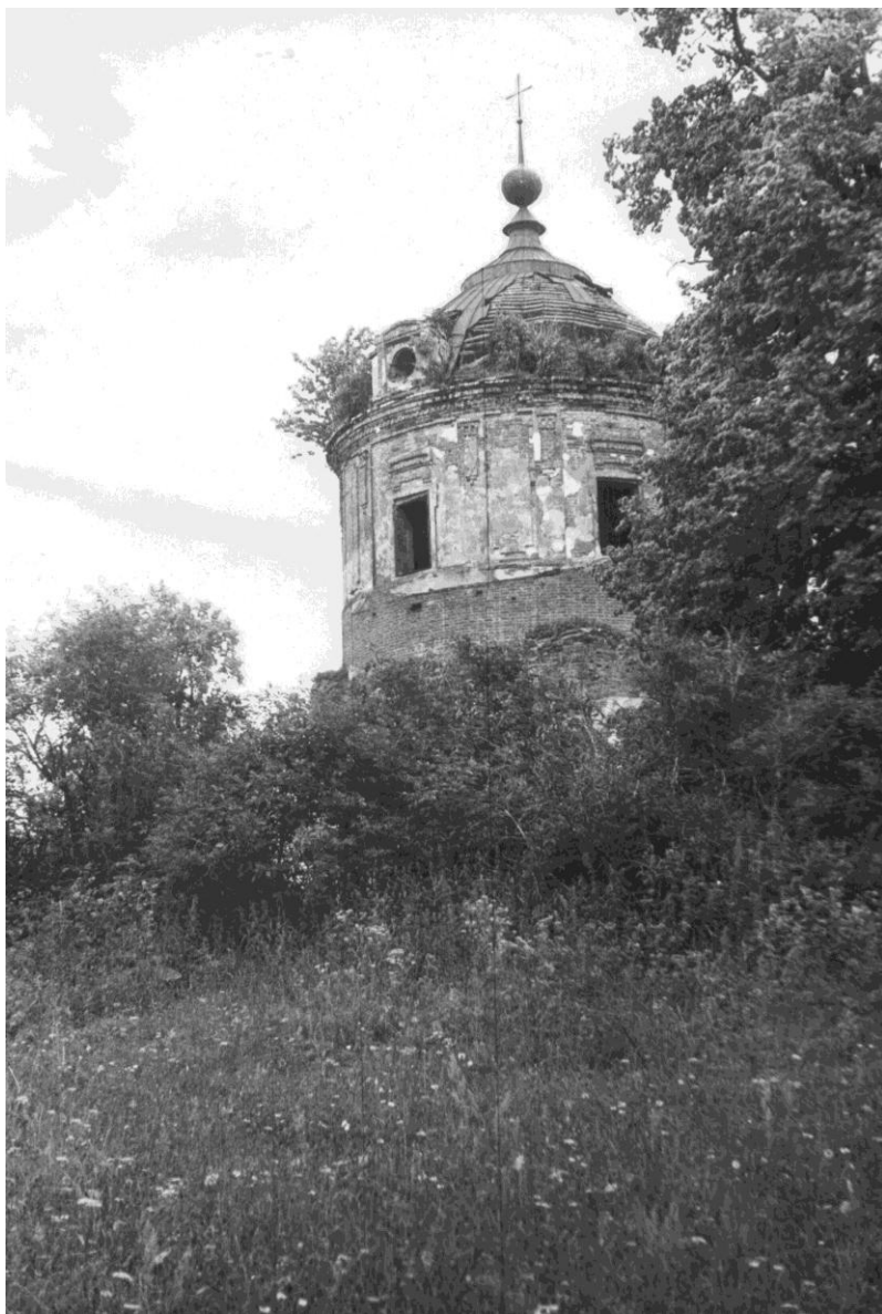
Церковь Спаса Преображения Состояние до консервации Фото кон. XX в.