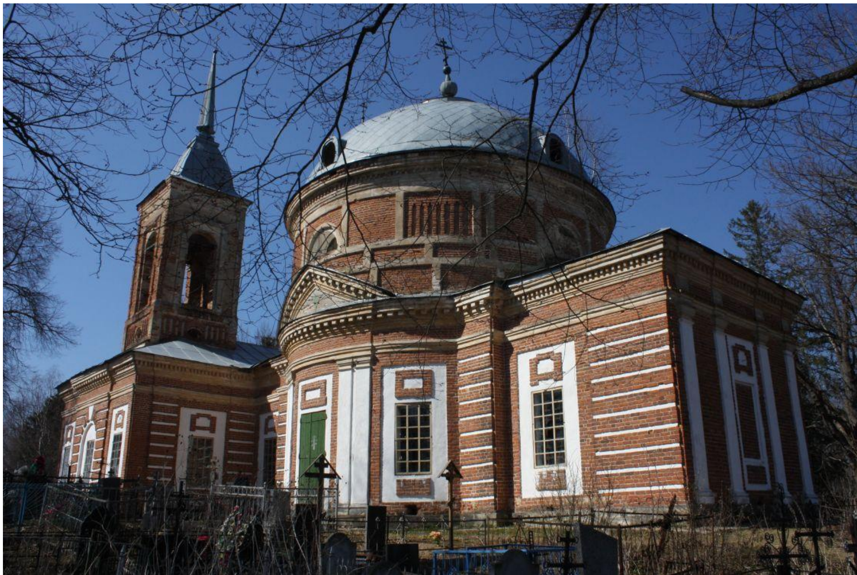
Церковь Преображения Господня Фото 2020 г.