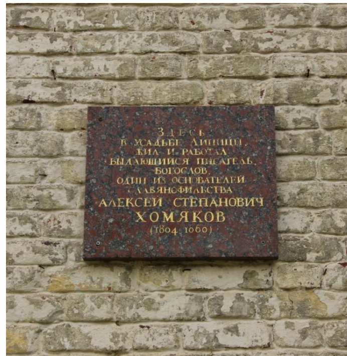
Мемориальная доска, посвященная А. С. Хомякову Фото 2020 г.