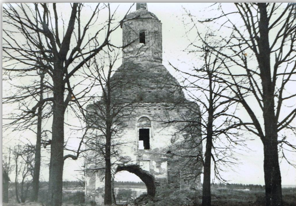
Усадебная церковь иконы Казанской Божией Матери (1759 г.) Фото 1950-х (?) гг.

В период Великой Отечественной войны Хмелита была оккупирована фашистами. В марте 1943 года во время отступления они взорвали колокольню усадебной церкви иконы Казанской Божией Матери , построенной Ф. А. Грибоедовым