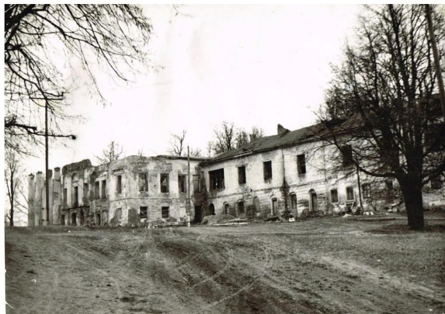
Хмелита. Усадебный дом после пожара Фото 1960-х гг.

Хмелита, переживя тяжелые годы революции, Великой Отечественной войны и оккупации, погибла в пожаре в 1954 г.