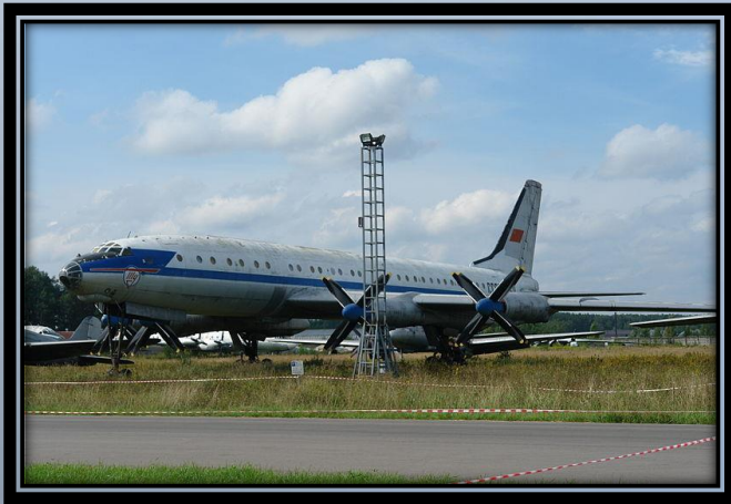
Ту-114 в Центральном музее ВВС в Монине

Андрей Туполев прожил долгую жизнь, был почетным гражданином Нью-Йорка, Парижа и подмосковного города Жуковский, трижды Героем социалистического труда. Скончался 23 декабря 1972 года и похоронен на Новодевичьем кладбище в Москве.