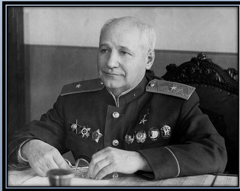
Генерал-майор авиационно-технической службы А. Н. Туполев, 1944

Андрей Николаевич Туполев - выдающийся советский ученый и авиаконструктор, один из отцов-основателей современного самолетостроения. Запущенная под его руководством самолеты серии «Ту» составили основу авиапарка в СССР и постсоветской России. В 2019 году именем Туполева назван московский аэропорт «Внуково».