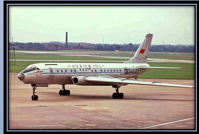
Ту-104Б 1-го Ленинградского авиаотряда Министерства гражданской авиации СССР («Аэрофлот») (Манчестер, 1974 год)