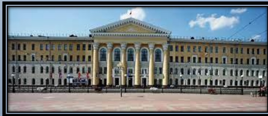
Казанский национальный исследовательский технический университет им. А. Н. Туполева

Именем Туполева названы улицы в десятках городов мира (не только в России, но, например, и в Амстердаме). Его же имя носит Казанский государственный технический университет.