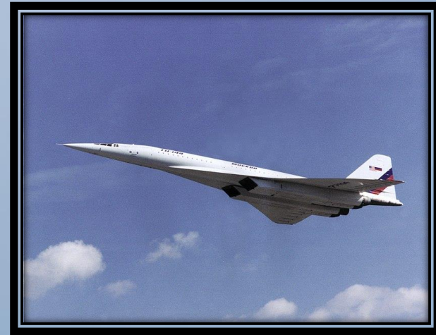
Ту-144ЛЛ над аэродромом в Жуковском