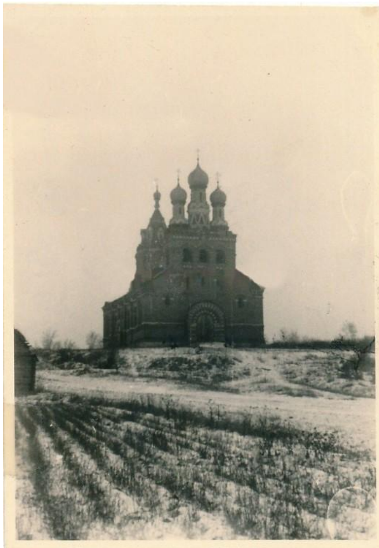
Церковь Покрова Пресвятой Богородицы