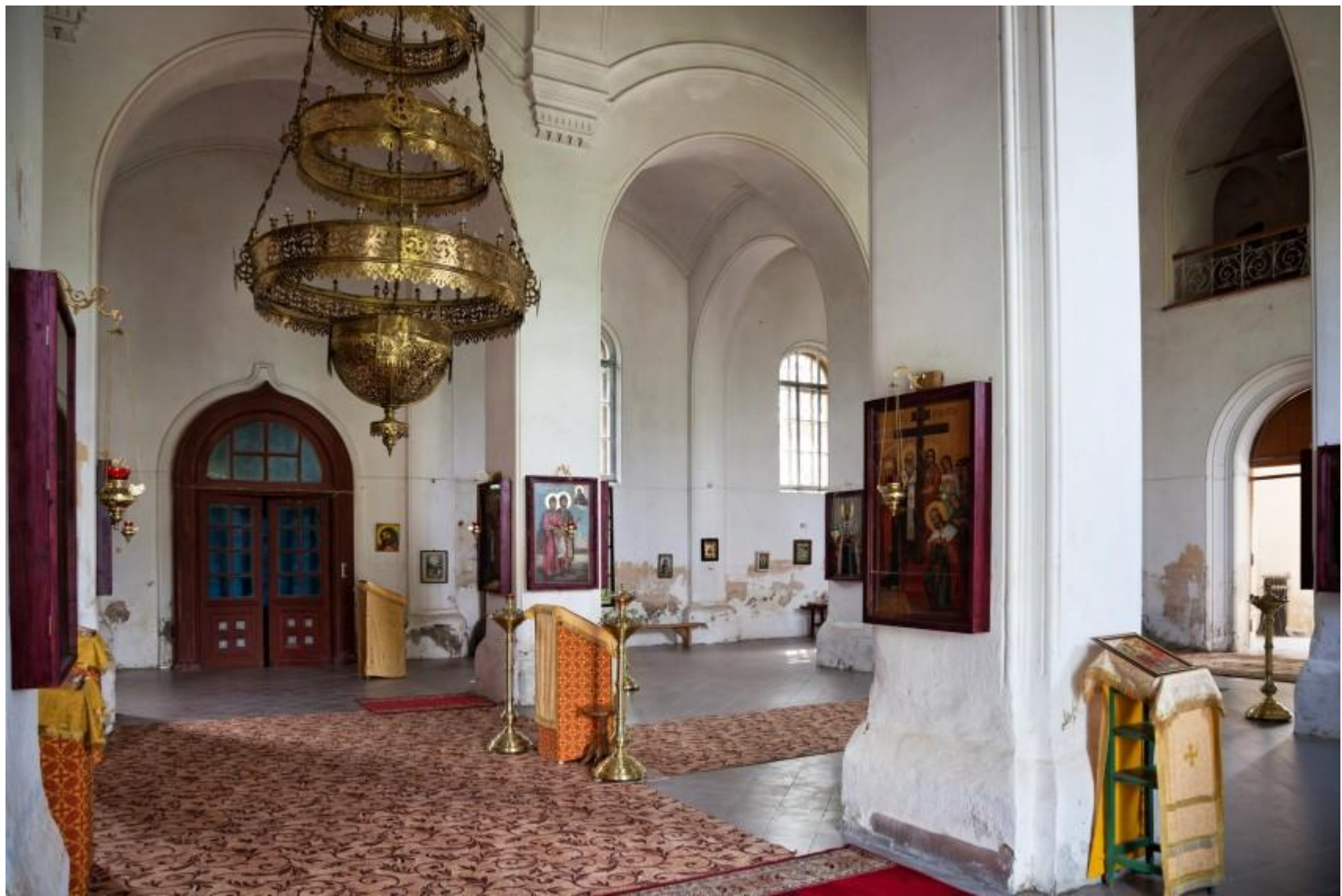
Внутренне убранство церкви Покрова Пресвятой Богородицы Фото 2018 г.