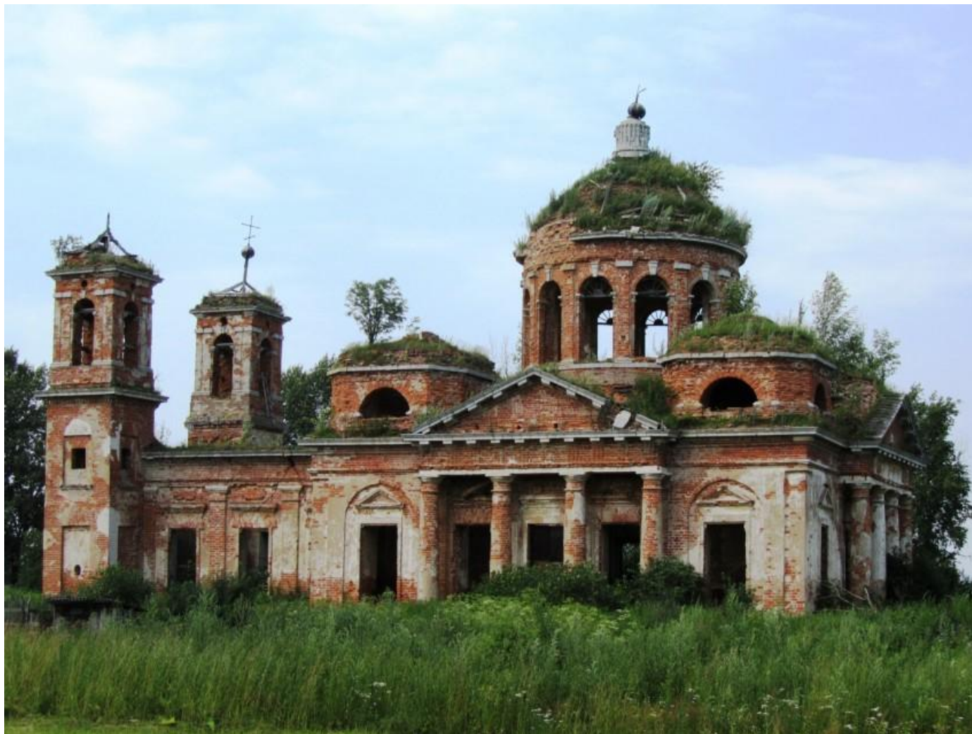
Церковь Троицы Живоначальной в Федеево до реставрации Фото 16 июля 2011 г.

Из всего усадебного комплекса до наших дней сохранилась только церковь Троицы Живоначальной, однако и она 30 июня 1910 года сильно пострадала при пожаре