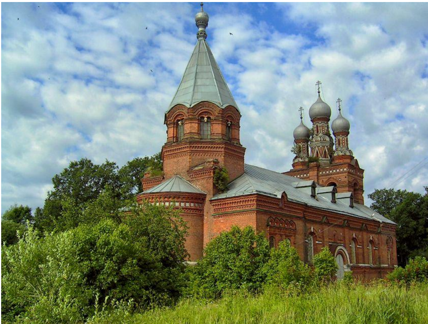
Церковь Покрова Пресвятой Богородицы в Дуброво Фото 2018 г.