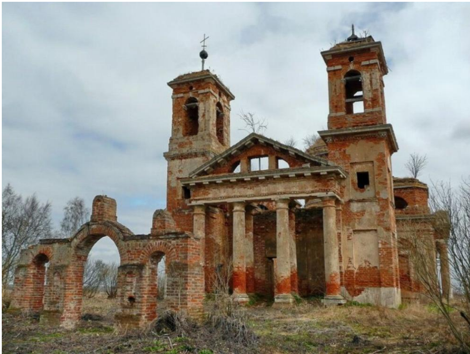
Церковь Троицы Живоначальной до реставрации Фото 2011 г.