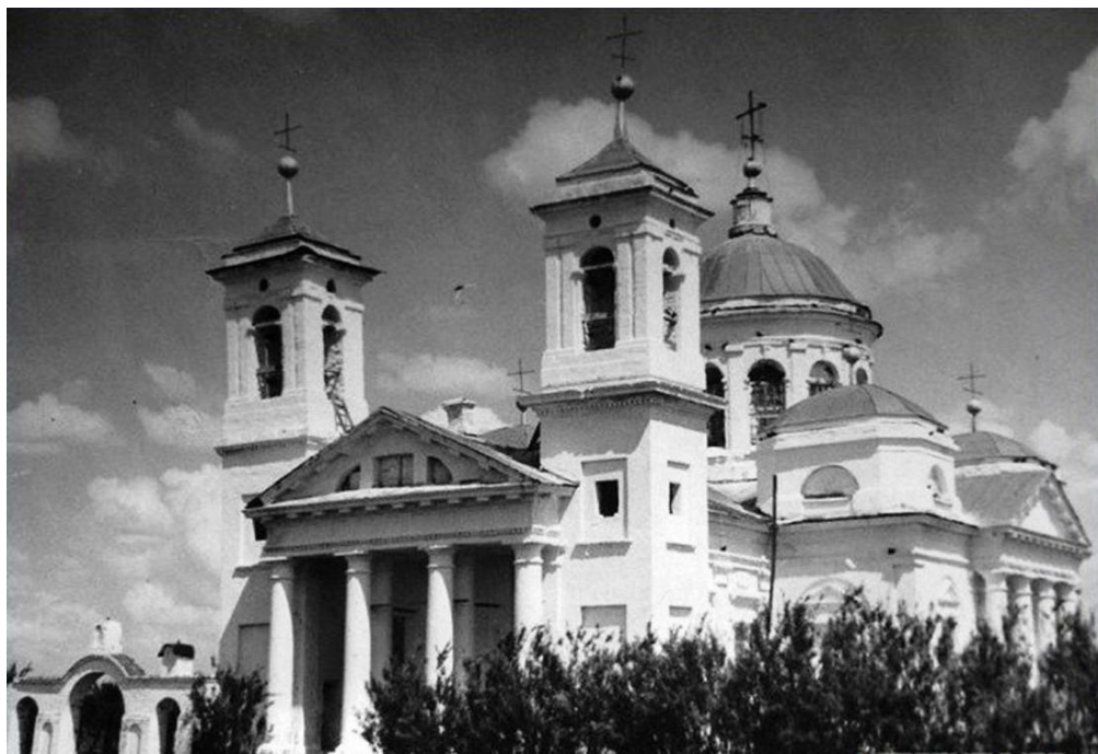
Церковь Троицы Живоначальной в Федяево

Грибоедовыми федяевское имение впоследствии было продано. С середины XIX века и вплоть до Октябрьской революции 1917 года село Федяево являлось собственностью графов Рибопьер.