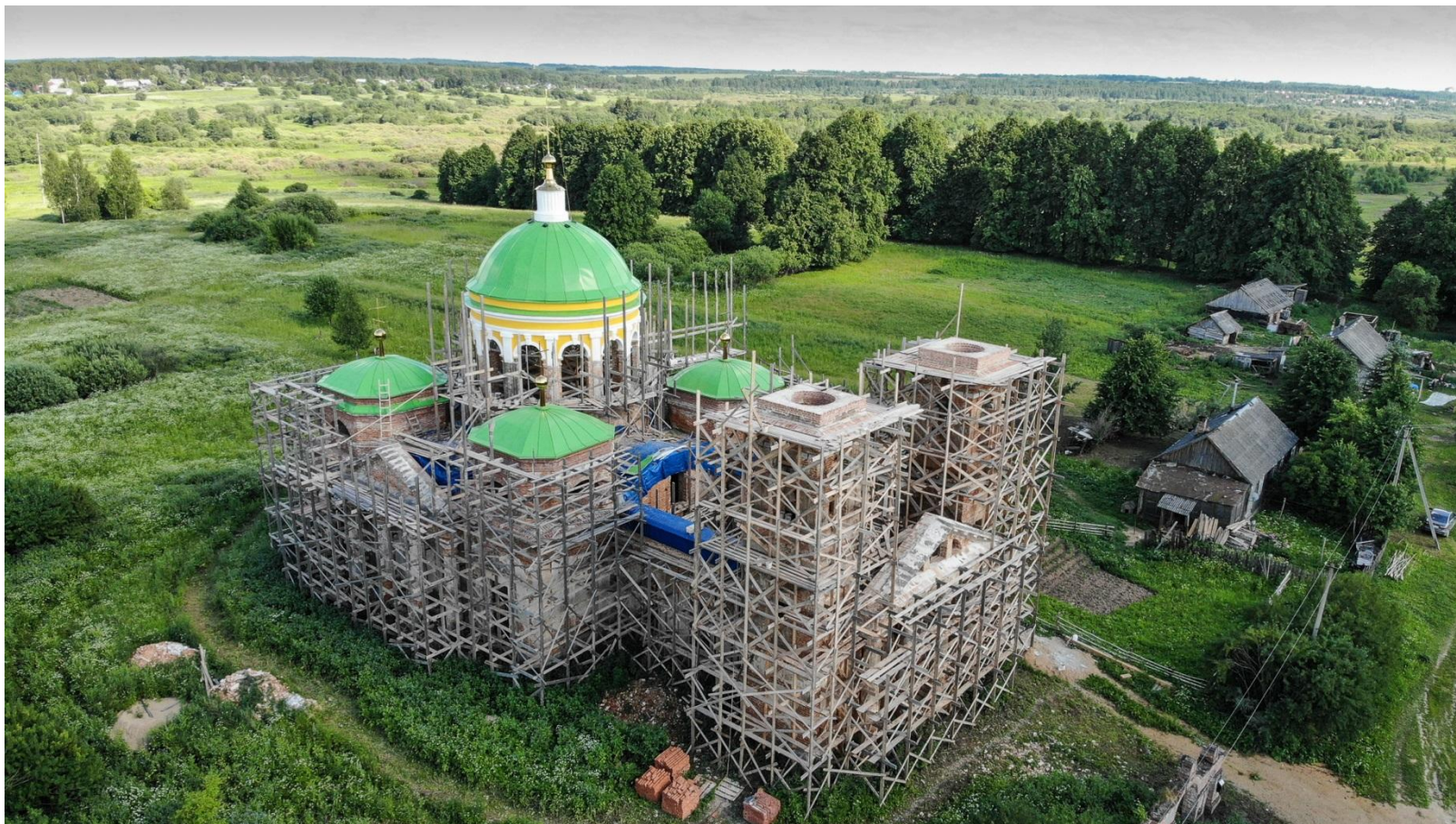
Церковь Троицы Живоначальной в процессе реставрации Фото 2018 г.

В 2017 году начались реставрационные работы храма, которые организовал неравнодушный меценат. На сегодняшний день в его восстановление вложено несколько миллионов рублей