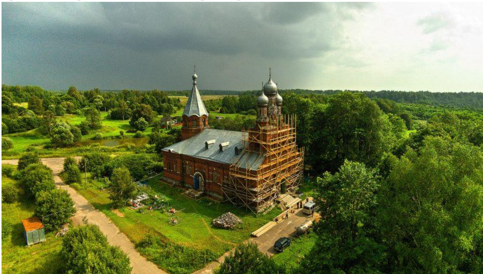
Церковь Покрова Пресвятой Богородицы в процессе реставрации Фото 2016 г.

Усадебный комплекс не сохранился до наших дней, но сейчас особое внимание к Дуброву привлекает церковь Покрова Пресвятой Владычицы Богородицы и Приснодевы Марии, построенная в 1893-1896 годах. Храм сочетает в себе древнерусские и западноевропейские архитектурные приемы и формы, что делает его уникальным памятником архитектуры. В 2016 году в храме была проведена масштабная реставрация