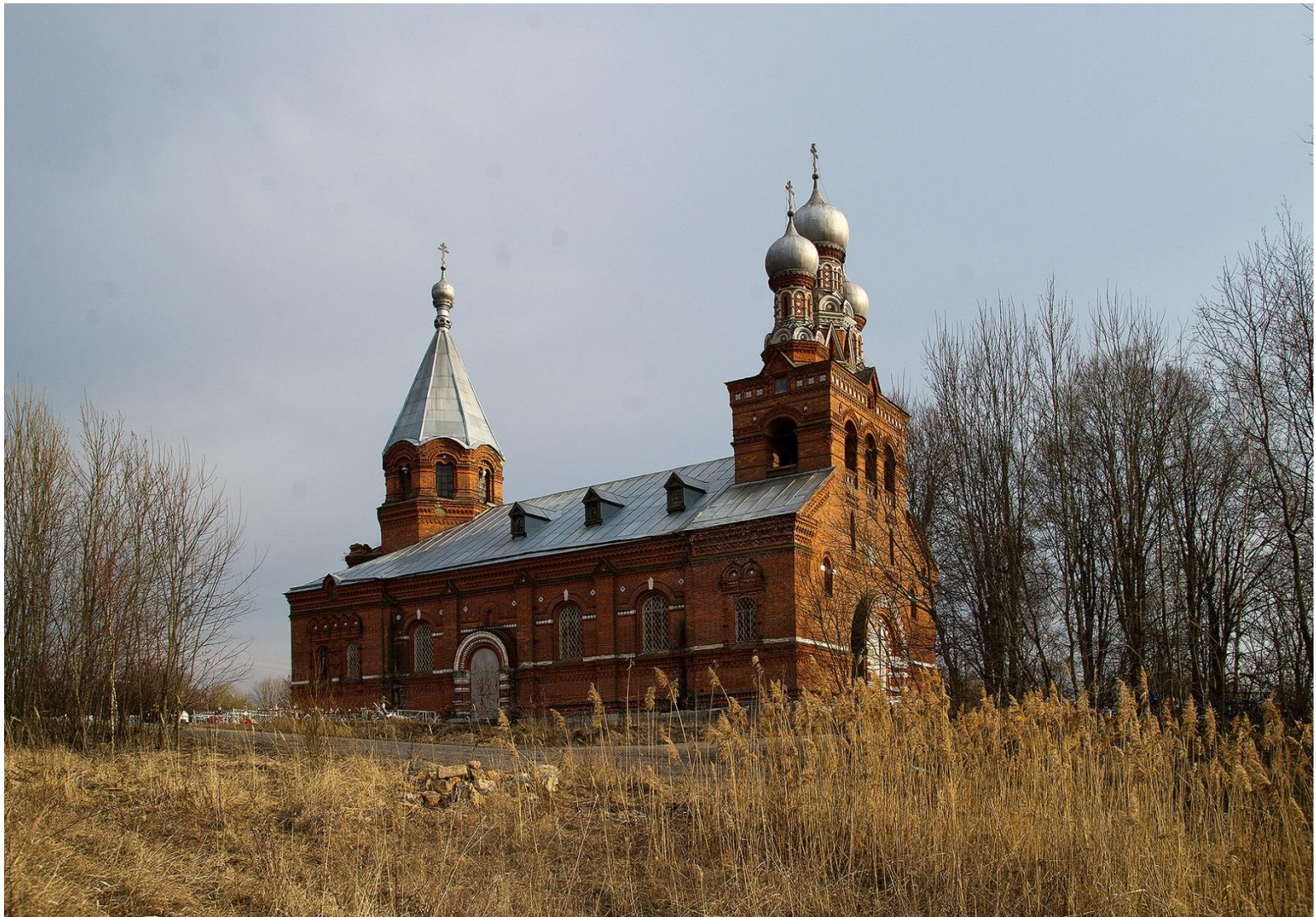
Дуброво. Церковь Покрова Пресвятой Богородицы Фото 2015 г.